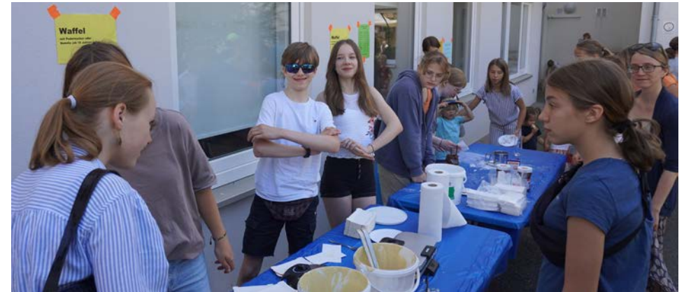
Am Waffelstand der Jugend kam es beim Gemeindefest wegen großen Andrangs gelegentlich zu Engpässen.

jetzt Raum und Platz für viele neue Gesichter. Vorbeikommen können alle ab 12 Jahren, jeden Donnerstag zwischen 17 und 20 Uhr in unserem wunderbaren Jugendraum im Fliestedenhaus. 17 – 20 Uhr bedeutet, dass in dieser Zeit der Jugendtreff geöffnet ist und nicht, dass du durchgängig da sein musst. Komm doch einfach mal vorbei und schau herein. Du bist herzlich eingeladen.