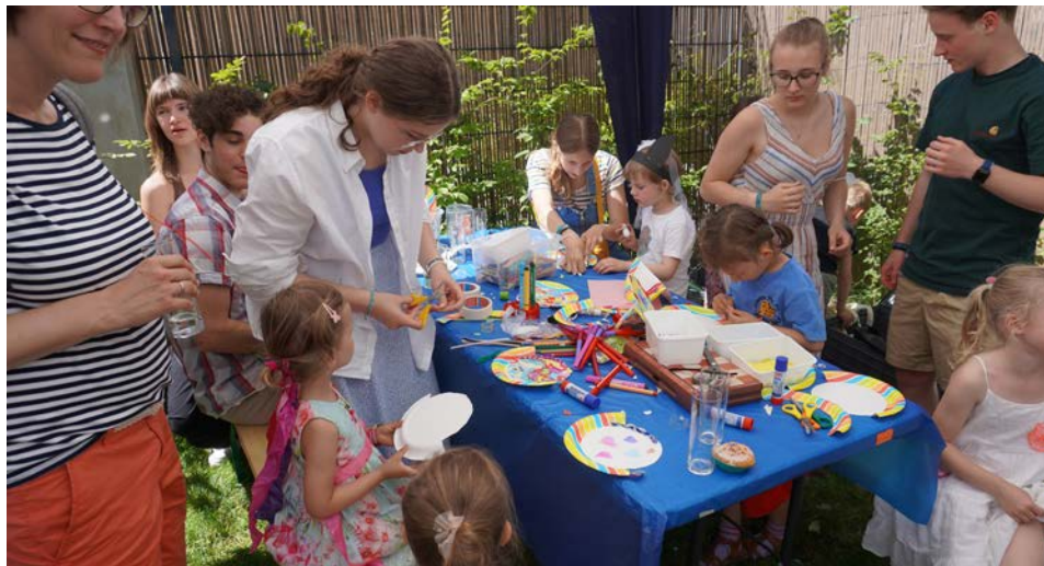
Sehr beliebt beim Gemeindefest: Die von Jugendlichen betreuten Spiele- und Bastelaktionen.

Komm vorbei zu unserem Jugendtreff! Jahrelang ein absoluter Selbstläufer, aber nun sind einige Jugendliche/junge Erwachsene dem Treff entwachsen. Deshalb ist spätestens