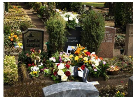
Auf Friedhöfen ist der Ewigkeitsgedanke für viele besonders wichtig.

Irgendwann kommt jede persönliche Biografie zu ihrem irdischen Ende: erfüllt, verfrüht, plötzlich oder nach langem Leiden. Dass das eigene Leben oder das anderer