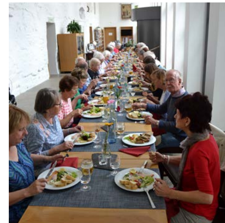
Die letzte Sommerfahrt der Frauenhilfe führte nach Fichtelberg. Hier speisten alle im Kloster Waldsassen, Oberfranken, in der Nähe der tschechischen Grenze.

Die ursprünglich diakonische Ausrichtung der Frauenhilfe, die aus dem christlichen Glauben heraus Dienst am bedürftigen Nächsten leistete, mag zwar heute auf Grund der sozialpolitischen Entwicklung nicht mehr die Hauptaufgabe der Frauenhilfearbeit sein, jedoch bleiben die Arbeit in Kirche und Diakonie sowie der Einsatz für die Gesellschaft, den die Frauenhilfen vielerorts leisten, eminent wichtig.