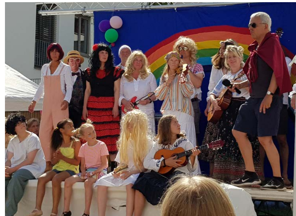
„All we are saying is give peace a chance“ – letzter Song der Bühnenshow mit allen Beteiligten.