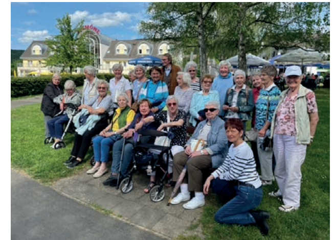
Endlich wieder ein gemeinsamer Ausflug nach der Pandemie.